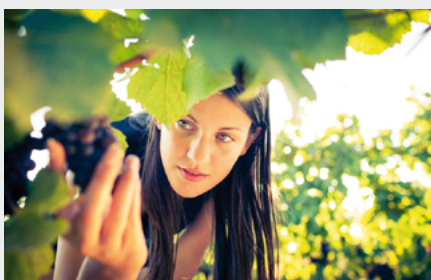
Kontinuierliche Transparenz und Dokumentation