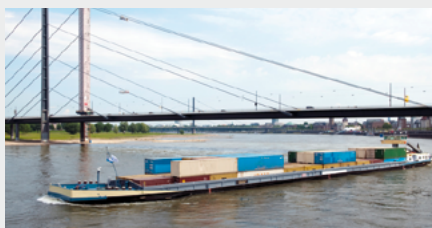
Kombinierter Verkehr: Die beste Lösung finden

Da diese Verkehre fahrplanmäßig getaktet sind, können wir sie optimal in unsere Transportketten integrieren.